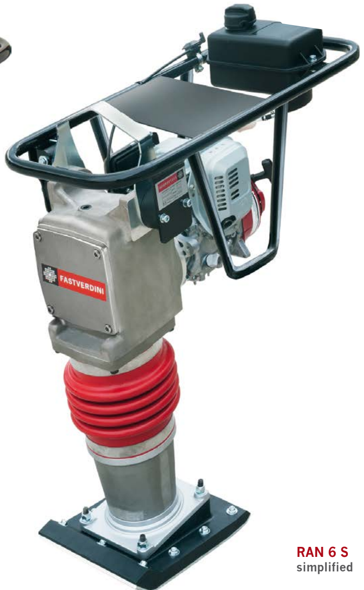
RAN 6 S simplified