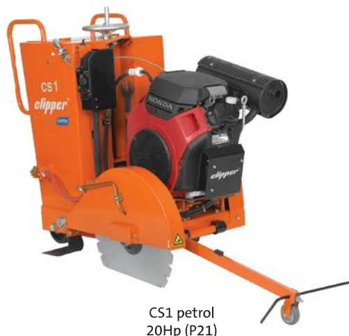
CS1 petrol 20Hp (P21)

Machines delivered without diamond blade.