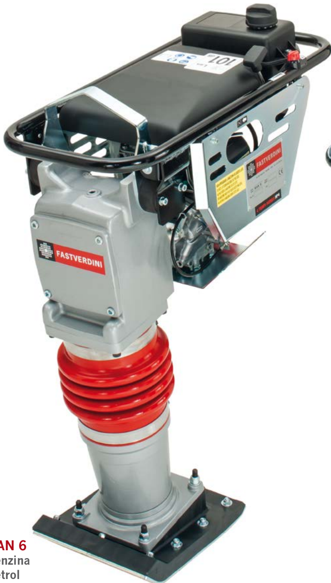
RAN 6 benzina petrol

Same construction characteristics as the RAN 6 model, with the difference that the handlebar is simpler with fewer lateral protection.