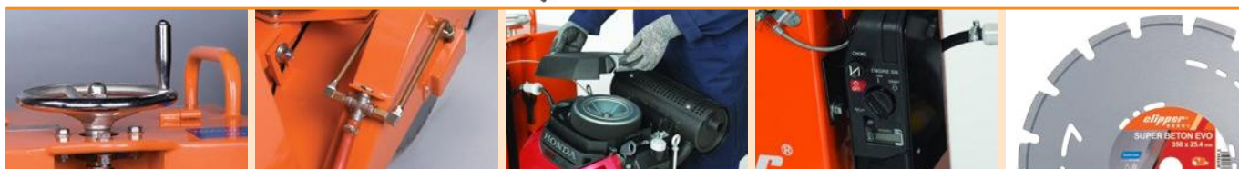
Hand wheel with endless screw depth control system

Machines delivered without diamond blade.