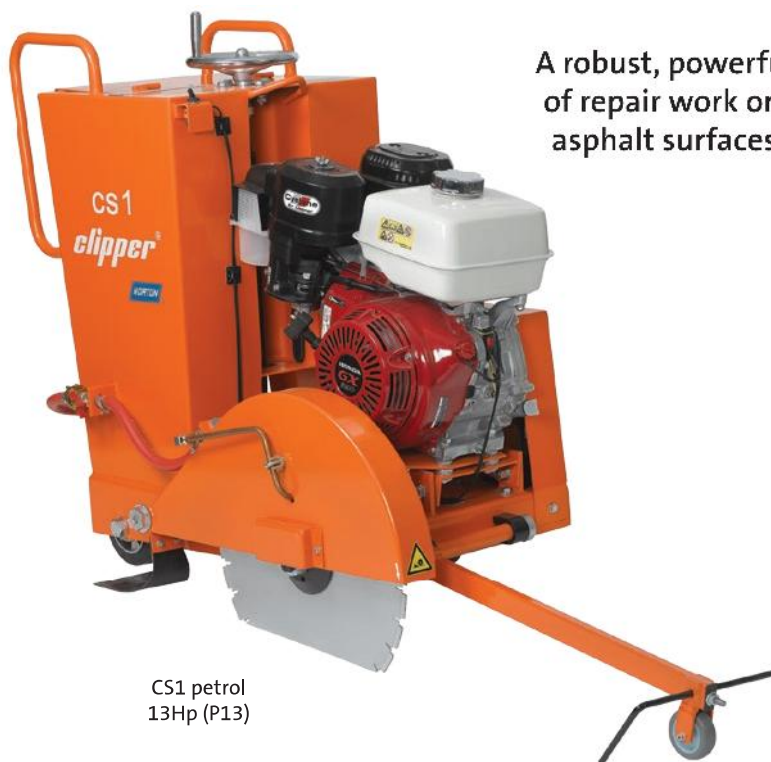
CS1 petrol 13Hp (P13)

A robust, powerful machine for all types of repair work on both concrete and asphalt surfaces.