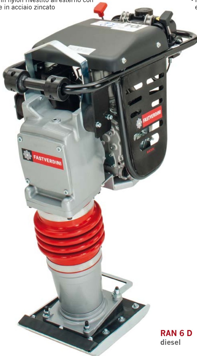
RAN 6 D diesel